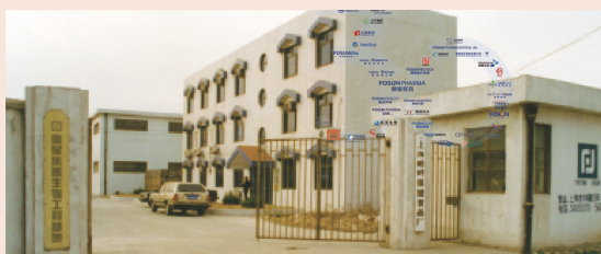
1994年1月14日，上海复星实业公司在上海成立（2004年更名为复星医药）。