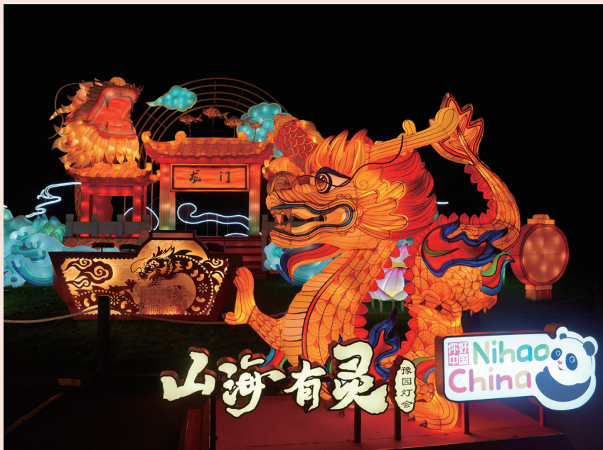
法国当地时间1月31日17点30分，中国文化和旅游部“吉祥龙”灯组在法国豫园灯会现场点亮。

年我们将灯会带到法国巴黎，中国年味也走向了世界。流光溢彩，双城辉映，不仅让法国人民充分感受中国文化和东方生活美学的魅力，也为中法建交60周年、中法文旅年献礼。未来，我们会将灯会带到全球更多地区，将其打造成一个世界性的中国品牌，真正实现中国文化的世界表达。”