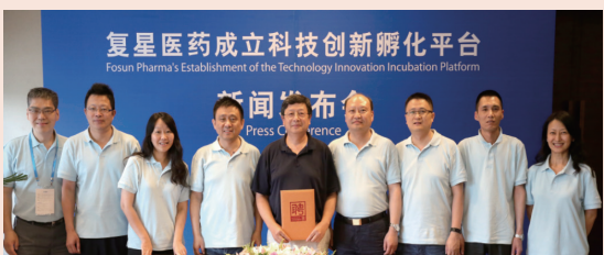
2017年，通过组建合营公司、成立科技创新孵化平台及探索合伙制创新研发等多元化合作方式，推动高科技产品的全球开发，实现全球创新前沿技术的转化落地，造福患者。