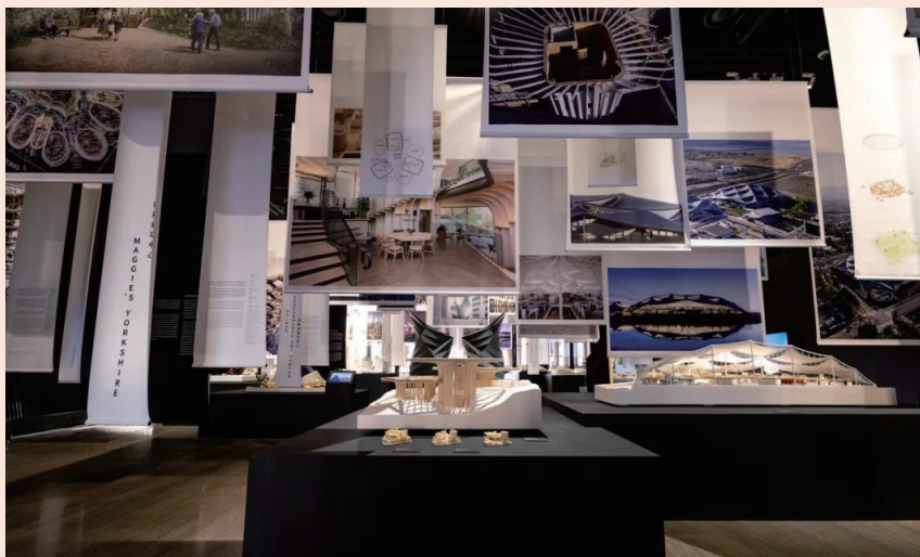
“构建灵魂建筑”展厅

自然界在无时无刻地变化着，从中产生的能量丰富并活跃着城市环境中人们的心灵和思想。赫斯维克工作室在每个项目中，都希望设计出让人们喜爱和享受的场所。自