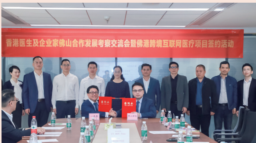
佛港跨境互联网医疗项目在佛山复星禅诚医院签约落地

本次项目通过佛山、香港双向医疗服务线上和线下的合作,由香港-港康医疗科技有限公司联合佛山复星禅诚医院等佛山知名医疗机构,打造“香港-港康 Doctor Q 跨境医疗平台”,探索香港跨境线上医疗服务与内地医疗机构的合作模式。Doctor Q 跨境医疗服务平台是一个整合香港优质医疗资源的线上平台。目前平台入驻了超过百位香港专科医生、全科医生、中医、牙医、各种治疗师、心理学家等医疗相关从业人员,为用户提供线上预约香港医生,线上视像就诊,香港医生开具香港药物,实时香港医疗咨询等多项服务。在 Doctor Q 平台上,用户可通过线上视像就诊的方式,与香港医生进行交流。用户只需与医生分享自己的病情,医生便会为用户制定合适的治疗方案,让用户足不出户就可享受到香港优质的医疗资源和服务。此外,用户还可以通过