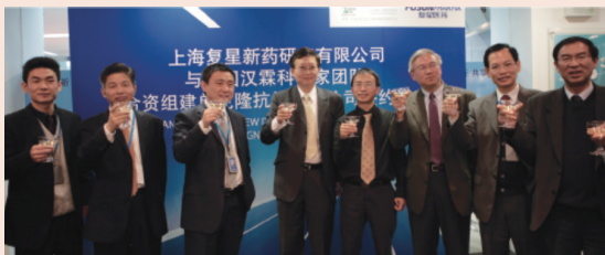
2009年，坚定创新驱动，布局前沿技术。携手科学家团队成立小分子化学药创新平台复创医药和生物药创新平台复宏汉霖。