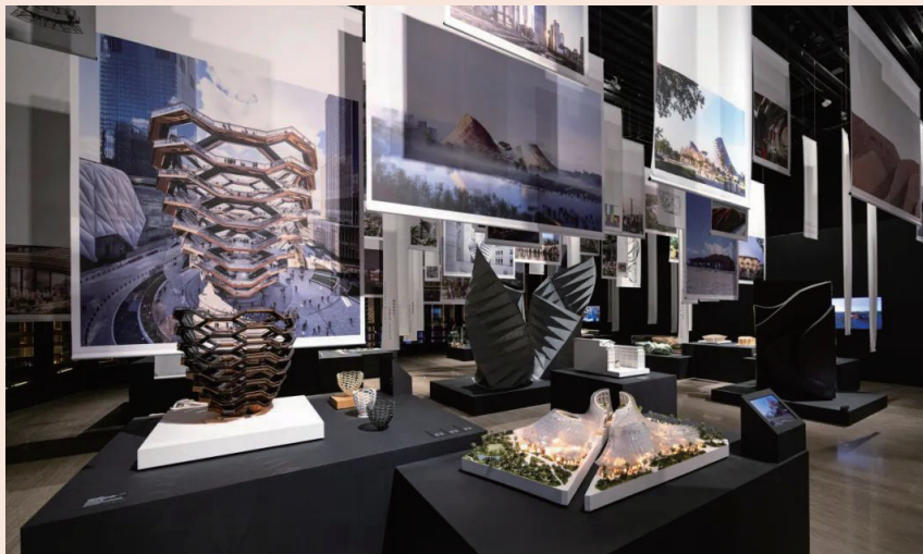
“构建灵魂建筑”展览作品

然在这过程中扮演重要角色，树木和植物不仅仅是装饰品，而是能将自然世界的能量和精神福祉融入城市环境。