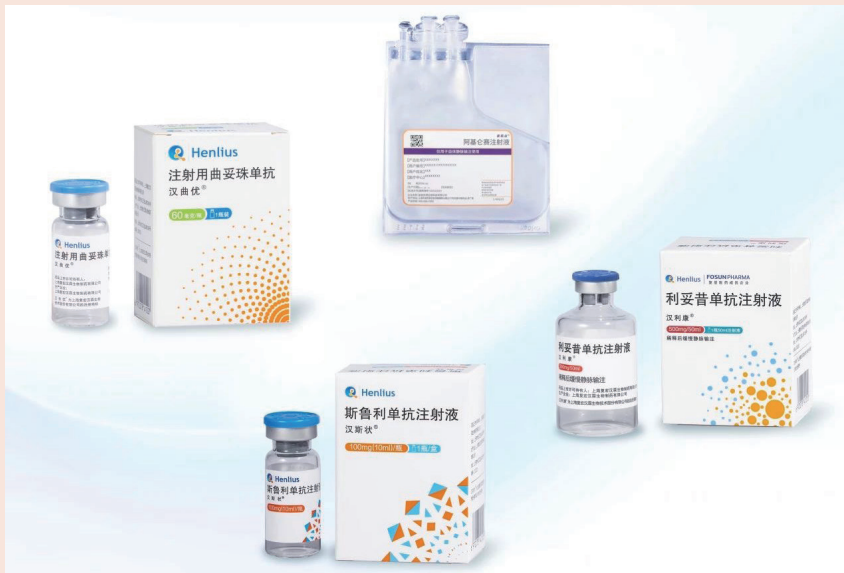
复星医药创新药引领“全球首款”、“中国首个” 图为：汉利康、汉曲优、汉斯状、CAR-T 细胞治疗产品奕凯达

2019年中国首款生物类似药汉利康获批上市，填补了国内生物类似药市场空白，惠及14万中国患者。后续上市的首个中欧两地获批国产单抗生物类似药汉曲优已在全球40多个国家和地区获批上市，全球首个获批一线治疗小细胞肺癌的抗PD-1单抗药物H药汉斯状攻克“治疗荒漠”，都是我们坚持科创引领的印证；