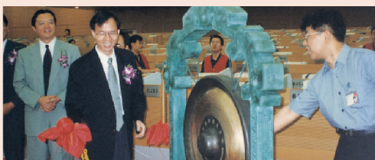
1998年8月7日，复星医药于上交所挂牌交易，成为上海第一家民营上市公司、全国生物医药产业第一家上市的民营企业。