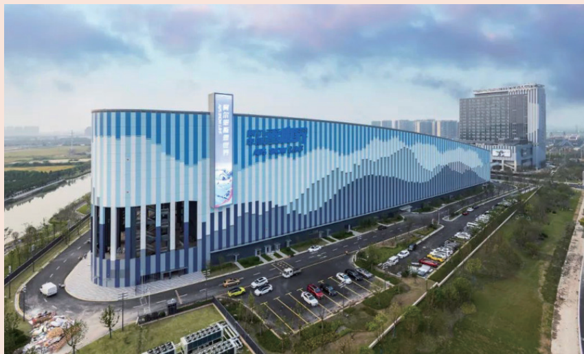
太仓阿尔卑斯雪世界

施工团队表示，通过墙面上的大尺度深蓝色图案及深蓝色吊顶，通过对山的形状肌理的雕刻，通过雪山小镇建筑的巧妙安排穿插，搭配灯光效果，他们首先模拟出“日出”氛围。