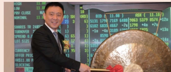
2012年10月，复星医药H股于香港联交所主板上市，形成了A+H的资本市场布局，进一步拓展了融资渠道，加快国际化发展的步伐。