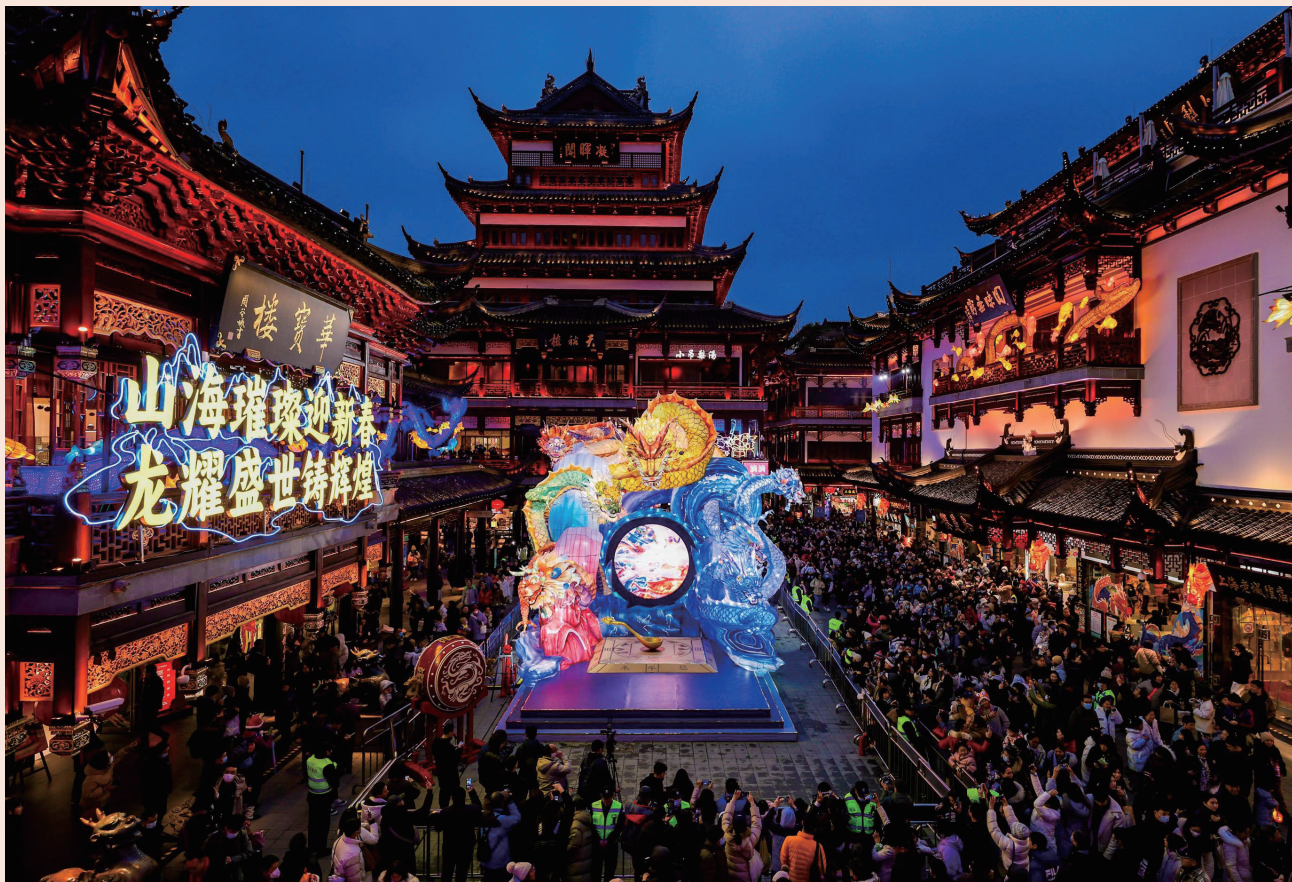
2024 豫园灯会亮灯首日游客络绎不绝