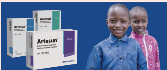
2010年，自主研发的注射用青蒿琥酯Artesun®通过WHO预认证，成为首个获WHO推荐的重症疟疾一线治疗药物。