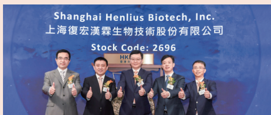
2019年9月，复宏汉霖于香港联交所主板上市，如今已成为港交所18A率先靠产品销售实现盈利的创新药公司。