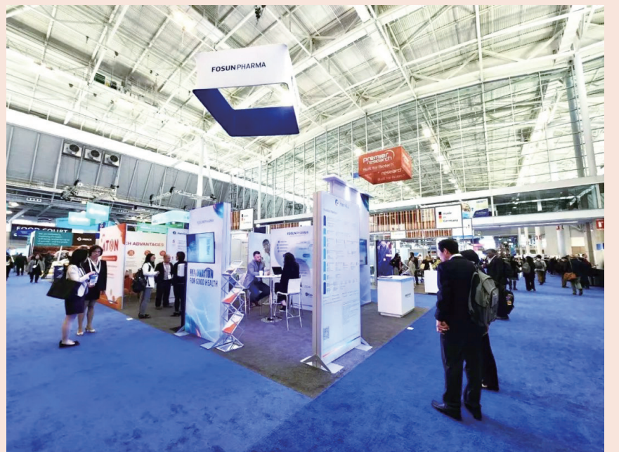
复宏汉霖秀出创新产品

复星医药以患者为中心、临床需求为导向，通过自主研发、合作开发、许可引进、深度孵化的方式，持续丰富创新产品管线，提升FIC (First-in-class, 即同类