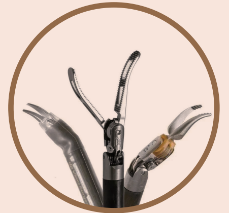
达芬奇手术机器人可转腕机械臂

同时，直观复星积极开展并参与手术人才培养，助力更多的中国外科医生掌握全球领先的机器人辅助手术技术。2021年