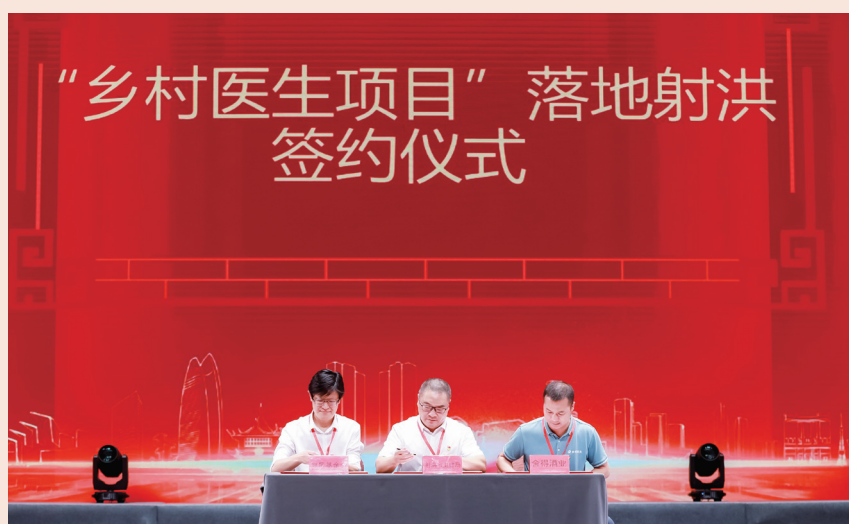
乡村医生项目落地射洪签约仪式

助学、抗疫救灾等积极投入。早在1994年，舍得酒业就开始向射洪中学捐资捐物，还专门设立沱牌教育奖励基金，修建实验学校。2019年，舍得酒业向射洪慈善总会捐款1000万元，用于当地扶贫济困、灾后重建和贫困大学新生救助、困境儿童救助等慈善公益项目。2020年初新冠疫情暴发，舍得酒业向射洪慈善总会捐款500万元用于当地疫情防控。2022年末至2023年初，舍得酒业