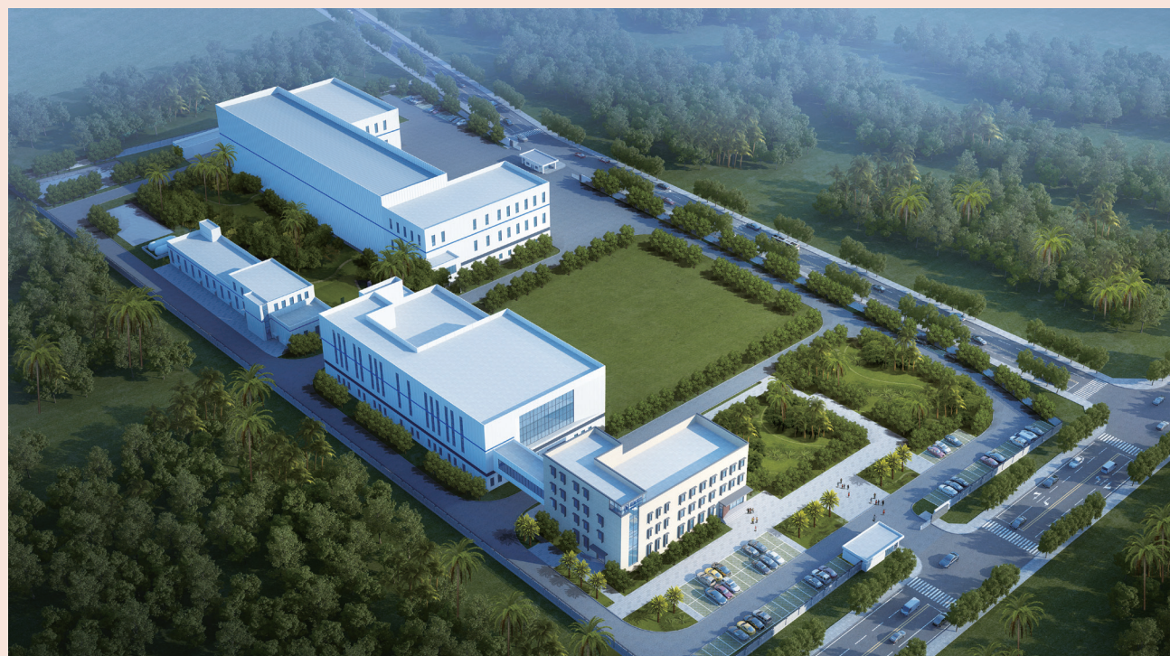
科特迪瓦项目园区一期鸟瞰图

在此之前的5月28日，复星诊断全新实验室自动化系统F-A7000 series在第二届中国国际检验医学暨输血仪器试剂博览会重磅发布。F-A7000 series具备灵活配置、精致小巧、智能化管理等优势，可助力从样本周转时间、仪器运营效率、布局设计等方面提升实验室整体检测效能。