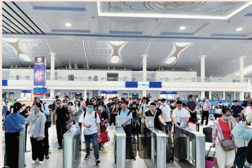
杭绍台铁路台州站客流旺盛