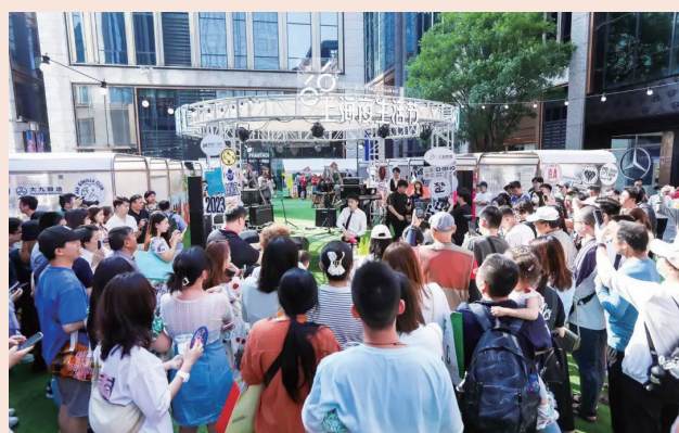
Open Night 开夜大集

BFC外滩枫径还重磅打造了“明日清醒”微醺市集，在白天和夜晚分别化身音乐会客厅及微醺潮玩社区，提供美食美酒的丰富选择；与此同时，音乐社群活动、潮流