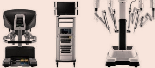
已投入中国医院使用的达芬奇手术机器人

术机器人之一，达芬奇手术机器人集成三维高清视野、可转腕手术器械和直觉式动作控制三大特性，将外科医生手部动作的颤抖等问题自动滤除后转换成更精准的动作，其弯曲和旋转程度远超人手极限，让机器人辅助手术变成现实。