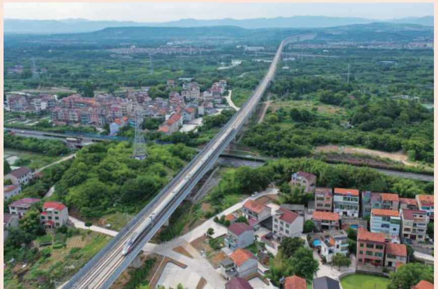
列车在杭绍台铁路飞驰

我国首条民营控股高铁——杭绍台铁路开通以来，不断发挥着杭州至台州“快捷通道”的作用，成为沿线人民群众出行以及上海往返温州、福州、广州等方向旅客乘坐高铁的线路优先选择。截至6月底，累计开行列车近两万列，运送旅客超千万人次。