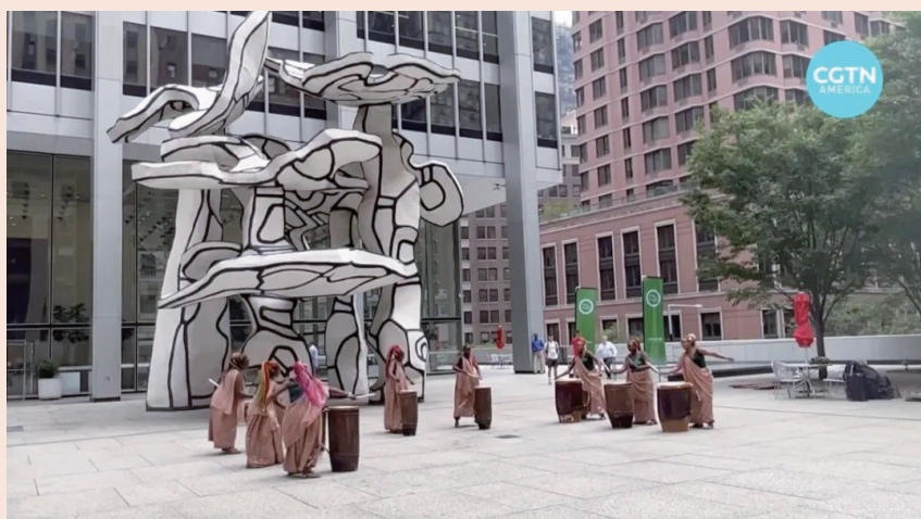
纽约 Liberty 大楼前复星广场上的演出

Sing for Hope于2010年首次推出，是世界上最大的年度公共艺术项目之一，至今已经有580多件“焕新”的钢琴艺术品