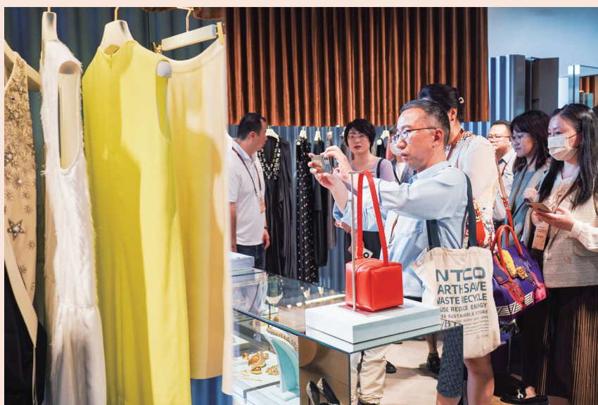
6月8日，投资者走访大豫园片区，调研复星旗下产业发展情况

与此同时，复星积极拓展融资渠道，进一步夯实资金安全垫。今年1月，复星获得由中国工商银行、中国农业银行、中国银行、中国建设银行、交通银行五大行联合牵头的中资银团120亿元人民币贷款；5月初，复星境外多币种银团贷款推出市场，截