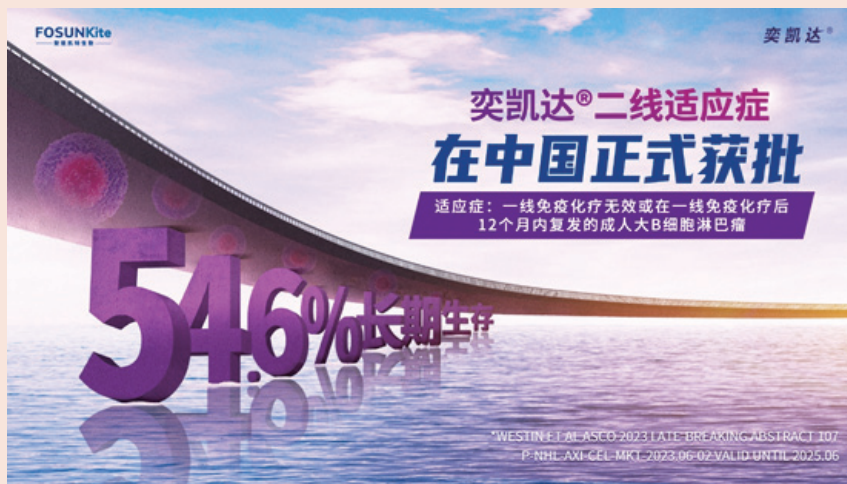
奕凯达®二线适应症获批为更多一线免疫化疗无效或复发患者带来希望

奕凯达是国内上市的首款CAR-T细胞治疗产品，最早获批时间是在2021年6月1日，彼时获批的适应症是用于治疗经过二线或以上系统性治疗后成人患者的复发或难治性大B细胞淋巴瘤，即用于三线或三线以上