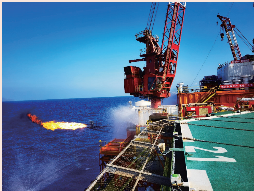
洛克石油惠州12-7油田

2022年10月，惠州12-7油田获得重大勘探突破，勘探井在古近系恩平组地层中共钻遇近50米净油层（垂厚），钻杆测试作业获得单层自喷日产超千桶的高产工业油流。随后开展了储量评估工作，并向中国政