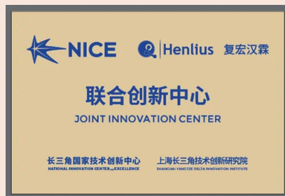
复宏汉霖与长三角国创中心、上海长三角技术创新研究院成立联合创新中心

驱动都很强的企业，希望我们未来能做深入地合作和对接，帮助复星的产业在科创驱动下发展得更好。”