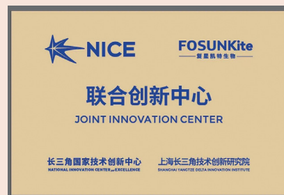
复星凯特与长三角国创中心、上海长三角技术创新研究院成立联合创新中心

龙头企业共同成立“企业联合创新中心”，合作开展企业技术路线研究、凝练企业愿意出资解决的“技术真需求”，寻求先进技术解决方案、组织关键技术攻关和集成创新等。如此次双方将共同成立“NICE—复星凯特联合创新中心”、“NICE—复宏汉霖联合创新中心”。