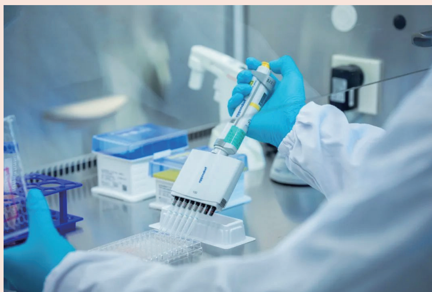
包括复星凯特在内的不少CAR-T企业都在尝试拓展更多适应症

为了减轻患者负担，帮助更多患者用得起优质可靠的高质量CAR-T药品，复星凯特依托国家多层次医疗保障体系的建设，积极与政府、医院、慈善基金、商业保险公司各方展开合作，推动奕凯达®纳入人保健康、平安人寿、众安保险、泰康在