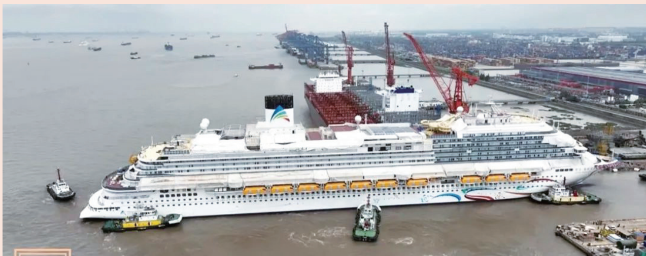
由南钢独家供钢的首艘国产大型邮轮“爱达·魔都号”正式出坞

本次储量获批是该油田正式启动开发建设的前提，有利于持续推动洛克石油与中国海油的长期合作，并将进一步增强洛克石油资产资源规模及提升公司在油气业务领域的竞争力。