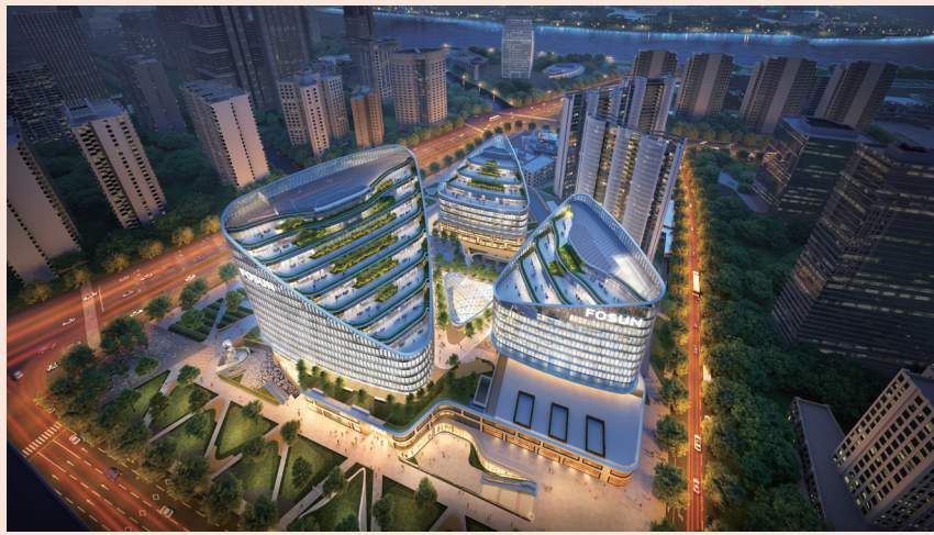
徐汇滨江复星中心（过程效果图）

围绕“产、地、房”战略，复地目前正在锚定核心城市与目标产业，充分发挥复星的全球化能力与生态协同能力，以产业基