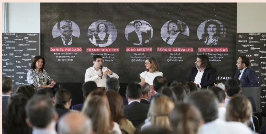
Protechting 6.0 开幕论坛

前五届的比赛诞生了多支优秀队伍，Protechting 6.0将邀请历届优秀团队来华交流，拟在上海、南京、澳门和北京进行路演。Protechting 6.0也将联动澳门创新创业大赛（澳中致远投资发展有限公司、澳门科学技术协进会、青年创业创新培育筹备委员会合办）、全球网络峰会Web Summit，促进海内外交流。截至目前，2023澳门青年创新创业大赛已吸引122个项目报名，将于7月5日的决赛中推选出前三强和“初创潜力奖”等奖项，输送至Protechting 6.0参赛。